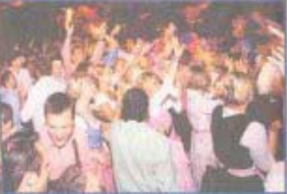
• Vorfreude ist die schönste Freude: Beim „Frühstart“ ist beste Stimmung garantiert • Die Band Barock sorgt für die richtige Musik