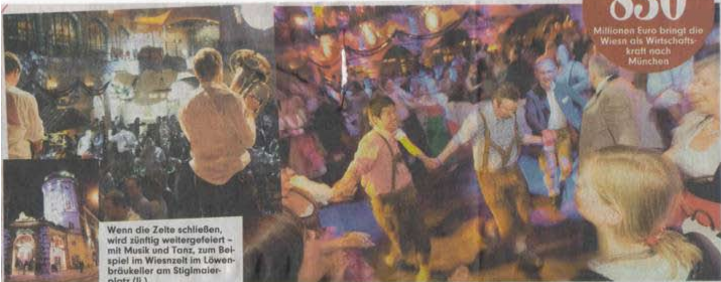
Wenn die Zelte schließen, wird zünftig weitergefeiert – mit Musik und Tanz, zum Beispiel im Wiesnzelt im Löwenbräukeller am Stiglmaierplatz (li.)

Millionen Euro bringt die Wiesn als Wirtschaftskraft nach München