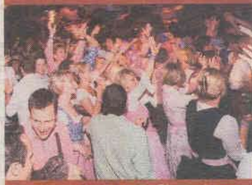
Die Hände zum Himmel – Riesenstimmung im „Wiesnzelt“ am Stiglmaierplatz