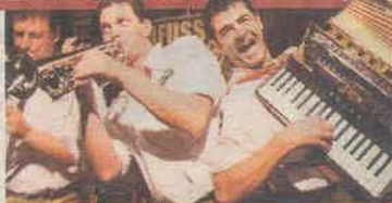
Rauf auf die Bühne, ran ans Mikro und „Wiesnzelt-Star 2009“ werden!

BILD-Leser, die abgestimmt haben, können ebenfalls Saalkarten gewinnen.